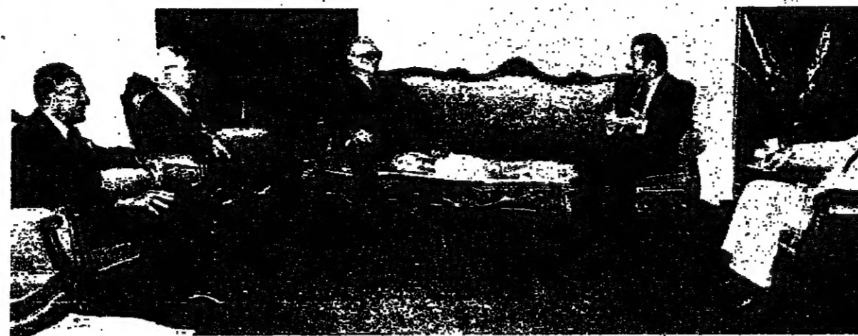
الرئيس الأسد في حديث مع الرئيس شمعون بيريز الإسرائيلي، وإلى يساره الوزير خدام

الرئيس السادات ورئيس الوزراء الإسرائيلي في بيروت